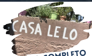
COCIDO COMPLETO EN CASA LELO

RESERVAS - 881 941 968 VIAJESDESTINOGALICIA.COM