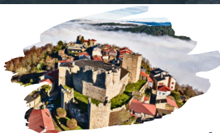
VISITA CASTRO CALDELAS

A CORUÑA - FERROL - FENE - PONTEDEUME CAMBRE - OLEIROS - SADA - BETANZOS - LUGO