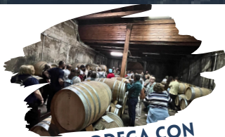
VISIT BODEGA CON DEGUSTACIÓN VINOS